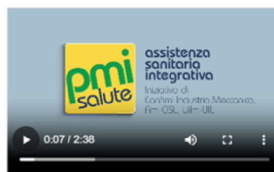
VIDEO ISCRITTI - Gestione del proprio nucleo familiare a carico sulla piattaforma informatica